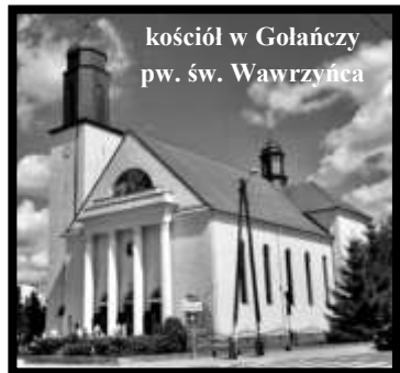
kościół w Golańczy pw. św. Wawrzyńca

Ołtarz główny zdobi Grupa Ukrzyżowania dłuta bydgoskiego rzeźbiarza Bronisława Kłobuckiego, nawiązująca tematycznie do ofiary złożonej z życia Jezusa Chrystusa.